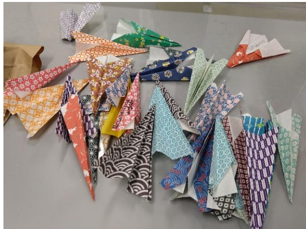
遠野西中学校の生徒の皆様からいただいたメッセージ付き紙飛行機