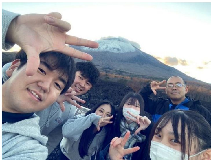
岩手山「焼走り溶岩流」と杉安副センター長とFROMメンバー