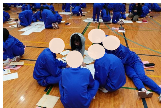
防災学習会「避難所運営ゲーム（HUG）地震版」の様子